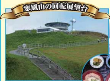
寒風山の回転展望台